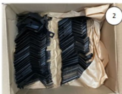
Abertura da embalagem e disponibilização para produção