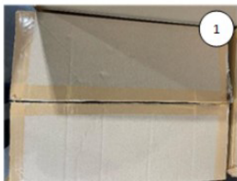
Os suportes são recebidos em embalados em caixa da origem