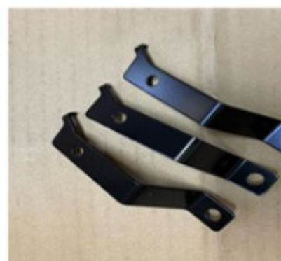
Os suportes disponíveis para processamento na fábrica do Br